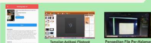
Tampilan Buku yang telah di Alih Mediakan dalam Aplikasi i-Sakris

Melakukan Pengadaan Alat Scanner otomatis untuk memudahkan unit Pelestarian dan Konservasi dalam melakukan Alih Media Koleksi