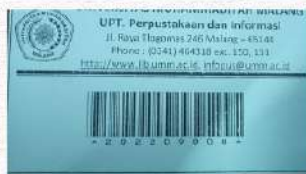
Contoh Kartu Anggota Perpustakaan UMM